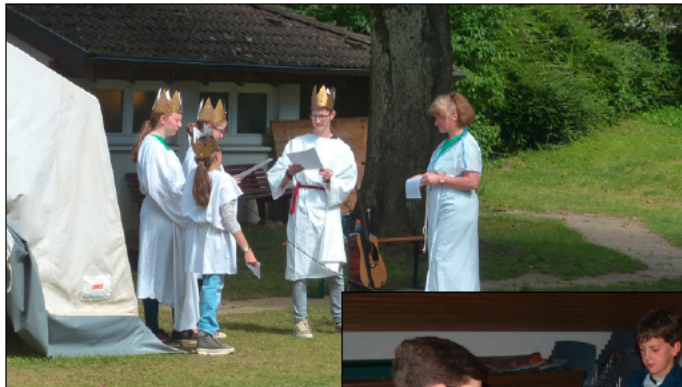
Anspielprobe für eine Szene „Nicht wie bei Räubers“